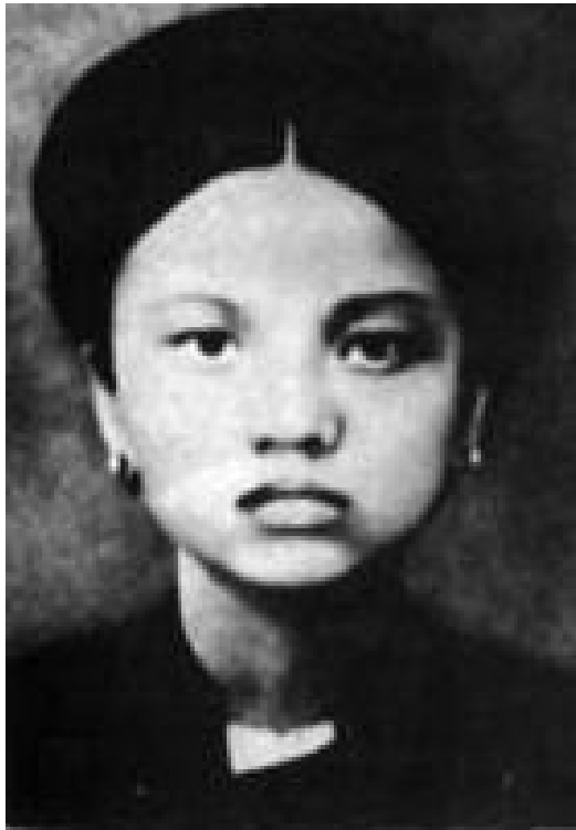
Tăng Tuyết Minh (người Tàu) và Nguyễn Thị Minh Khai

Trên đây là các tội phạm của họ Hồ trong lúc làm chủ tịch nước. Trong giai đoạn còn trong bóng tối, Hồ Chí Minh có rất nhiều đàn bà ở Tàu, Pháp, Liên Xô và Việt Nam :